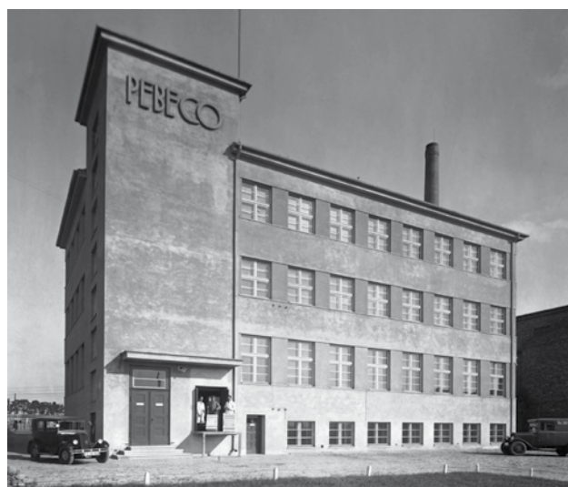
Firma Pebeco. Polskie Wytwory Beiersdorfa w Poznaniu

W związku z tym na świecie istniały dwie marki NIVEA: polska i międzynarodowa. Znak firmowy był ten sam, jednak asortyment kosmetyków był całkowicie odmienny. Sytuacja taka utrzymała się do lat 90. gdy Pollena-Lechia objęta została Programem Powszechnej Prywatyzacji. We wrześniu 1997 roku NFI Octava, Pollena-Lechia oraz Beiersdorf AG podpisały umowę inwestycyjną, na mocy której Beiersdorf AG stał się udziałowcem spółki. W listopadzie 1997 roku nazwę firmy zmieniono na Beiersdorf-Lechia. Od tej pory spółka stała się częścią koncernu Beiersdorf, a NIVEA w Polsce została włączona do międzynarodowej rodziny.