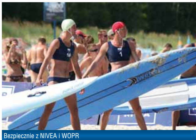
Bezpiecznie z NIVEA i WOPR

Bezpiecznie z NIVEA i WOPR to wieloletnia współpraca z Wodnym Ochotniczym Pogotowiem Ratunkowym na kąpieliskach strzeżonych w gminach nadmorskich oraz w wybranych miejscowościach na terenie całej Polski. Ma na celu poprawę stanu bezpieczeństwa osób przebywających, kąpiących się i uprawiających sporty wodne. W skład programu wchodzi szereg przedsięwzięć, m.in. „Mistrzostwa NIVEA Ratowników WOPR”, „Już pływam”, „Z Delfinkiem WOPR-usiem jest bezpiecznie” oraz „Letnia Szkoła”.