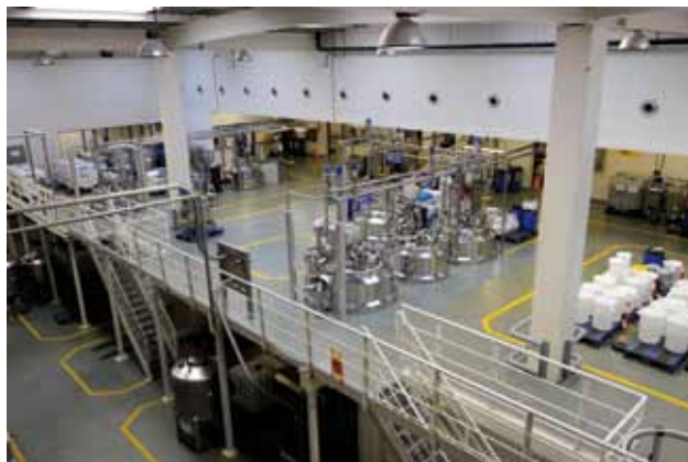
Zakład produkcyjny. Naważalnia

1 stycznia 2009 roku poznański zakład produkcyjny, który do tej pory wchodził w struktury NIVEA Polska został wydzielony jako osobny podmiot gospodarczy pod nazwą Beiersdorf Manufacturing Poznań Sp. z o.o.