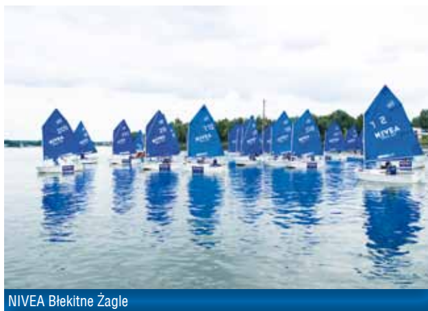
NIVEA Błękitne Żagle

NIVEA Błękitne Żagle to prekursorskie przedsięwzięcie na skalę światową, realizowane przy współpracy z Narodowym Stowarzyszeniem Klasy Optimist. Główną ideą akcji jest promowanie żeglarstwa jako sposobu na aktywny wypoczynek dzieci i ich rodzin. Nacisk położony jest na walor edukacyjny, czyli wychowywanie dzieci poprzez sport, stymulujący prawidłowy rozwój psychofizyczny. Program skierowany jest do najmłodszych żeglarzy w wieku do 11 lat. Obejmuje 35 uczniowskich klubów sportowych, które otrzymują wsparcie finansowe oraz sprzęt sportowy.