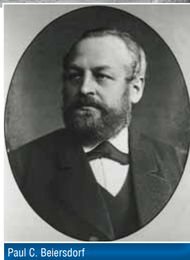
Paul C. Beiersdorf

Pierwszy na świecie krem wyprodukowany na bazie oleju i wody, o śnieżnobiałym kolorze powstał w Hamburgu już 100 lat temu. Jest panaceum na wszelkie skórne dolegliwości: pielęgnuje, łagodzi, odżywia, nawilża i odświeża. Może być stosowany przez wszystkich konsumentów w każdym wieku. Dzisiaj ten krem to ikona marki NIVEA.