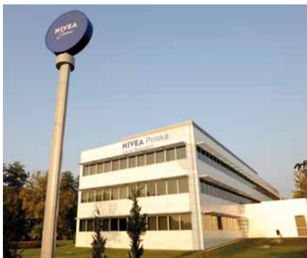
Biuro NIVEA Polska

Dzisiaj miliony ludzi na całym świecie używają produktów NIVEA. Jest ono światowym bestsellerem, które zachowało swój młody wygląd, mimo że ma już 100 lat.