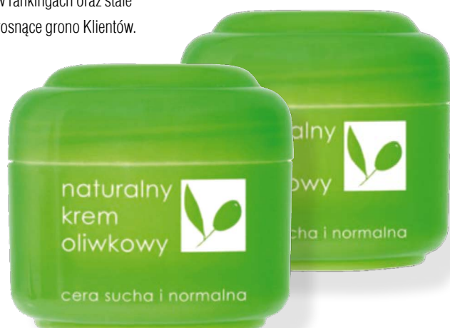
Naturalny krem oliwkowy- pierwszy produkt Ziaja

Obecnie Ziaja to marka, która obejmuje szeroką gamę nowoczesnych produktów do pielęgnacji twarzy, ciała i włosów, bazujących na naturalnych składnikach oraz recepturach tworzonych w oparciu o farmaceutyczne doświadczenie. Marka, będąca synonimem wysokiej jakości i atrakcyjnej ceny. Marka, której wysoką pozycję potwierdzają czołowe miejsca zajmowane w rankingach oraz stale rosnące grono Klientów.