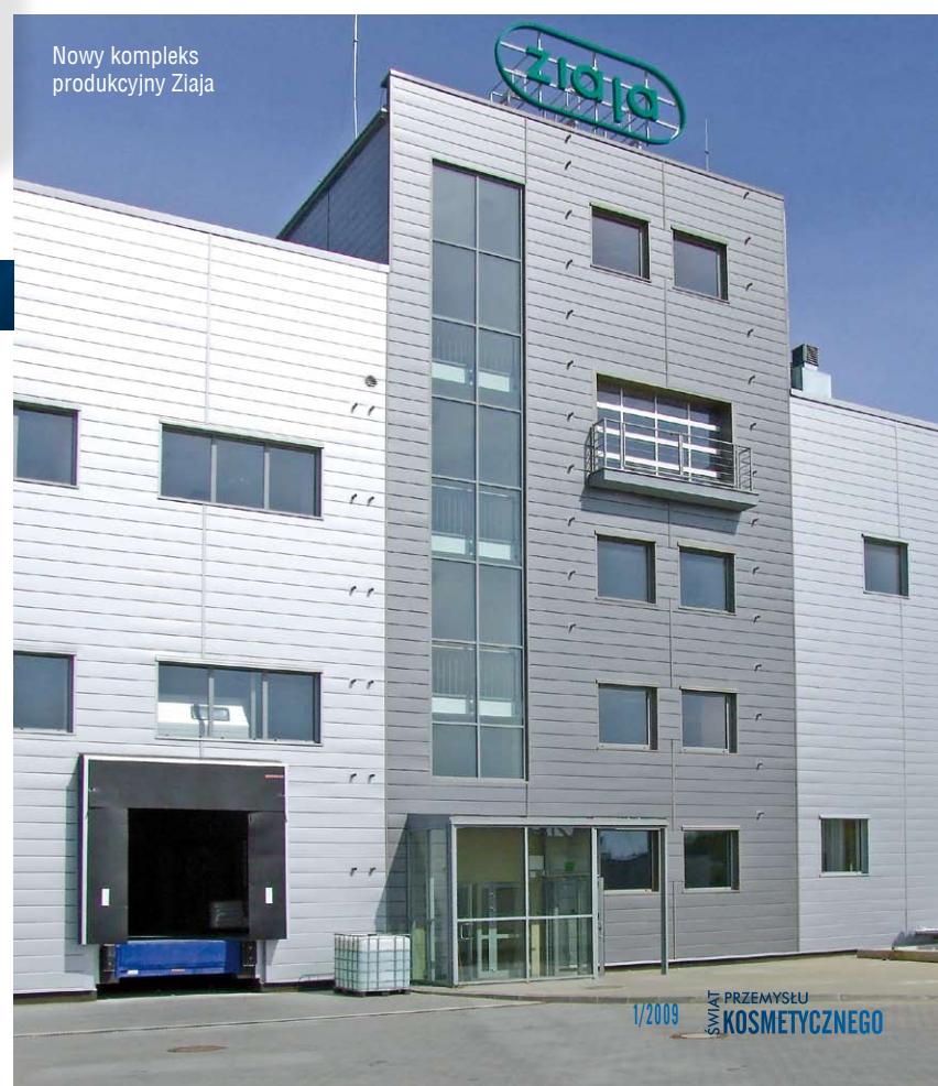
Nowy kompleks produkcyjny Ziaja

Preparaty ze znakiem ZIAJA produkowane są według najnowszych technologii światowych w dwóch nowoczesnych zakładach produkcyjnych położonych w ekologicznej strefie na Kaszubach. Obiekty należące do kompleksu zakładowego to dwie hale produkcyjne, magazyny wysokiego składowania, oraz cztery laboratoria o łącznej powierzchni 13 000 mkw. Produkcja to w pełni zautomatyzowane linie konfekcyjne oddzielne dla płynów i emulsji. Urządzenia, pomieszczenia oraz pracownicy objęci są ścisłym monitoringiem mikrobiologicznym i środowiskowym. Z taśm produkcyjnych schodzi miesięcznie ok. 3 mln sztuk produktów.